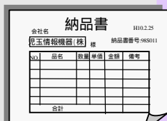
ワープロ手作り 伝票